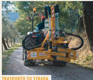
TRASPORTO SU STRADA