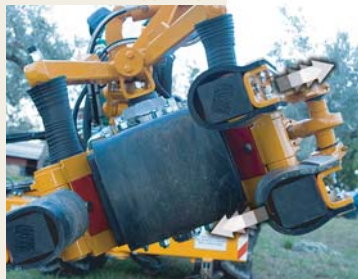
PINZA A TRE ARTICOLAZIONI