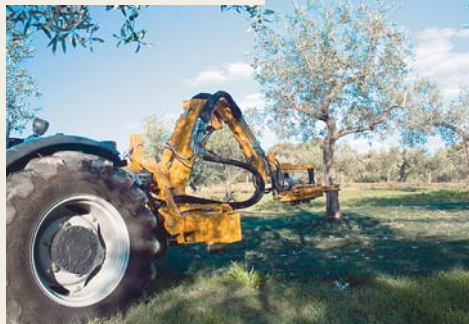
NON DANNEGGIA I PICCOLI FUSTI